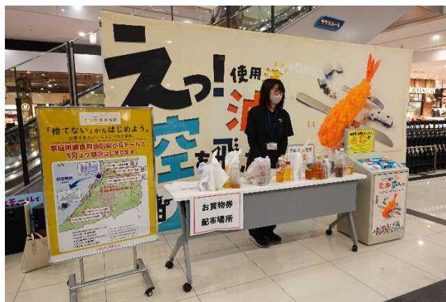
(上) (左) 廃食用油回収の様子