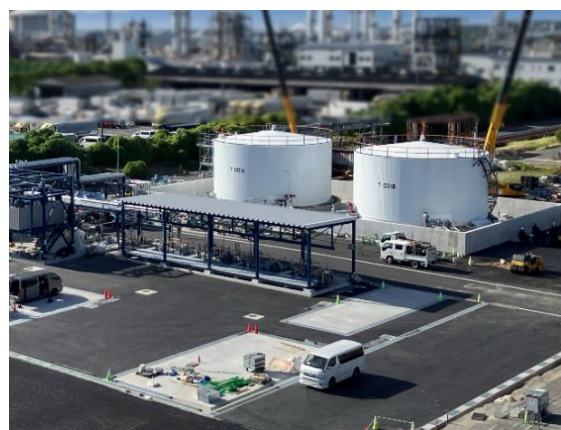
SAF の原料となる廃食用油受け入れ施設 (コスモ石油堺製油所構内)